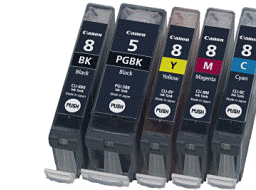
Cartouches Imprimante non substituables