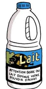
Lait avec DLC