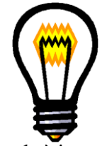
Ampoule à incandescence d'une durée de vie limitée à 1000h