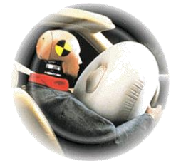
Airbags déclenchés sur voiture non cotée