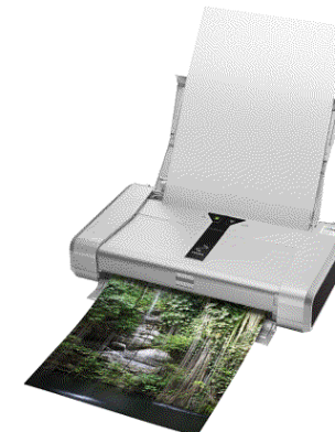
Imprimante avec puce comptant les impressions