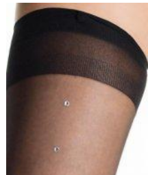
Bas Nylon effilé rapidement